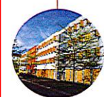
Plaza I Konrad-Zuse-Straße 7-9

Mit öffentlichen Verkehrsmitteln Anreise von der Saarbrücker Innenstadt möglich mit Bussen (Linien 101, 102, 122) und Bahn bis Haltestelle „Bahnhof Burbach/Saarterrassen“ direkt gegenüber des neuen Standorts. www.saarfahrplan.de