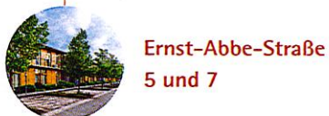
Ernst-Abbe-Straße 5 und 7