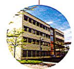
Plaza II Konrad-Zuse-Straße 5