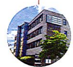
Plaza III Konrad-Zuse-Straße 3a